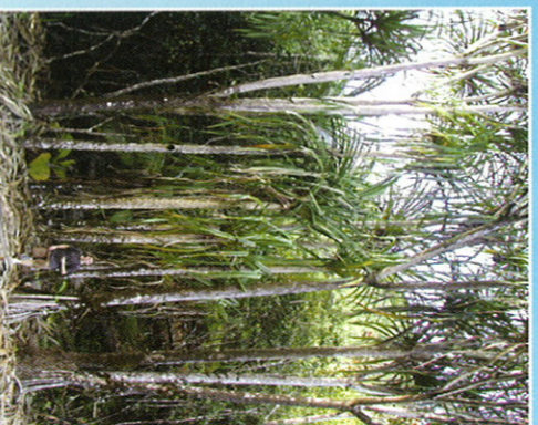
Vacoa Parasol ( Pandanus horniei )

corniche offrant une variété intéressante de plantes endémiques, dont des plantes carnivores. Le chemin principal continue quant à lui vers l'aval à travers la forêt en longeant la rivière. Le passage peut être difficile après de fortes pluies. Le chemin bifurque ensuite à gauche vers le haut et quitte la rivière pour passer la crête et redescendre ensuite par une série de marches jusqu'à la rivière de la Mare aux Cochons. De l'autre côté de la rivière se trouve une maison abandonnée