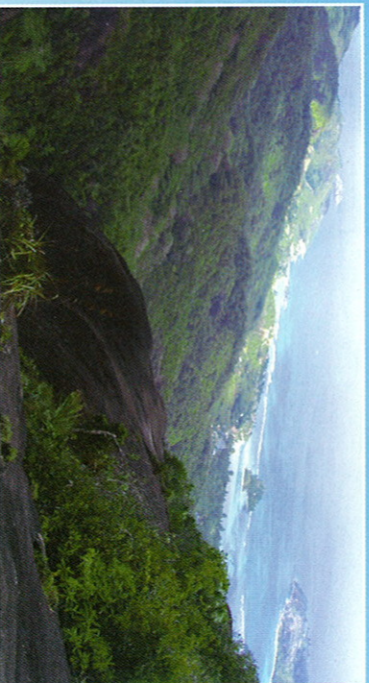
Glacis d'Antin - Vue sur la côte ouest

Des bus rejoignent Victoria de Port Glaud par la route 13 (via Grand Anse et La Misère), la route 14 (via Sans Souci) et la route 9 (au Sud par Les Cannelles).