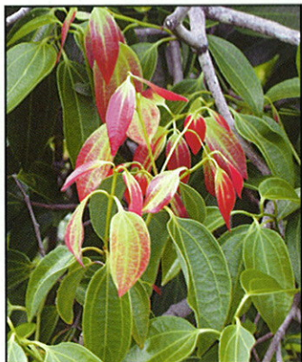
Cannelle ( C.verum )

La zone abrite aussi le petit duc endémique des Seychelles ( Otus insularis ), et des chauve-souris frugivores ( Pteropus s. seychellensis ) qui peuvent être aperçues quittant leur perchoir. A l'arrivée du chemin à Port Glaud se trouvent le long de la route les mangroves relictuelles parmi les plus belles des îles granitiques, particulièrement dans la direction de Port Launay, où les sept espèces d'arbres de mangroves sont présentes.