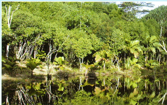
La mare aux cochons

Le chemin zigzague de façon raide vers une vallée située en aval et descend à travers la forêt. Les ruines d'une distillerie de cannelle attireront sans doute votre attention avant que vous n'atteigniez la route pavée qui continue vers le bas de la colline. Le terminus de Danzil du bus No.21 (Bel Ombre – Victoria) se situe au bord de la mer en bas du chemin.