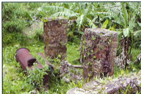
Ruines de distillerie

Le procédé de distillation d'abord assez rudimentaire dans la première partie du siècle s'est ensuite sophistiqué, donnant lieu à d'importants investissements en infrastructures. Ceci est reflété dans une certaine mesure par les ruines de distilleries. Celles situées en basse altitude sont restées opérationnelles jusqu'à plus récemment. D'énormes quantités de bois de chauffe étaient nécessaires pour produire la vapeur passant au travers des feuilles de cannelle. L'eau acheminée des rivières environnantes dans des bambous et ultérieurement dans des tuyaux de métal, servait à rafraîchir le distillat, de manière à pouvoir collecter l'huile. En 1955, plus de 90 tonnes d'huile de cannelle était exportées annuellement, représentant 70% de la production mondiale.