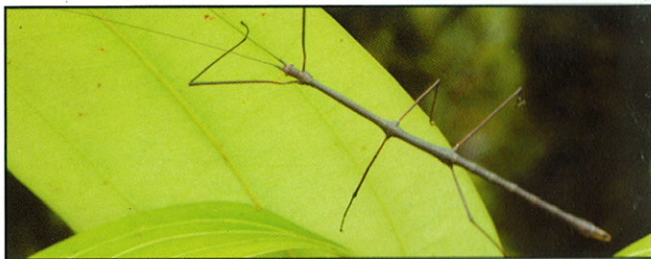
Phasme ( Carausius sp.)

La zone abrite aussi le petit duc endémique des Seychelles ( Otus insularis ), et des chauve-souris frugivores ( Pteropus s. seychellensis ) qui peuvent être aperçues quittant leur perchoir. A l'arrivée du chemin à Port Glaud se trouvent le long de la route les mangroves relictuelles parmi les plus belles des îles granitiques, particulièrement dans la direction de Port Launay, où les sept espèces d'arbres de mangroves sont présentes.