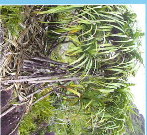
Vacoa Marron ( Pandanus sechellarum )

Calou ( Memycion eleganti ), Bois de Montagne ( Campnosperma sechellarum ) et Cappucin ( Northea Horniei ). Entre les deux points de vue principaux se situe une zone de forêt d'altitude, avec des fougères de plantes telles que mousses et fougères qui capturent la vapeur d'eau des brumes couronnant le sommet de la montagne.