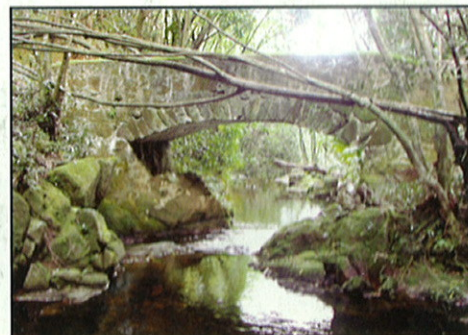
Le vieux pont des 'pères suisses'

autres la maison des prêtres, proche de la distillerie de la vallée de la Mare aux Cochons. Elle était aussi la 'Grand Case' de la mission catholique à cet endroit. Des maisons abandonnées plus récemment sont visibles à Mont d'Or, le long de la route qui mène à Port Glaud. Pendant les années 70, après la construction de l'aéroport qui entraîna le développement du tourisme au point d'en faire la première activité économique, l'industrie de la cannelle s'effondra petit à petit. Diverses tentatives ont été faites depuis pour la relancer, mais sans réel succès.