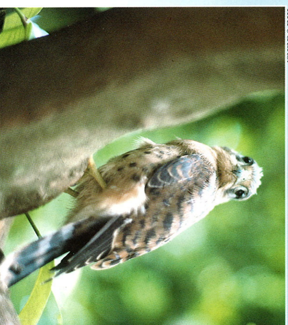
Kestrel ( Falco araea )