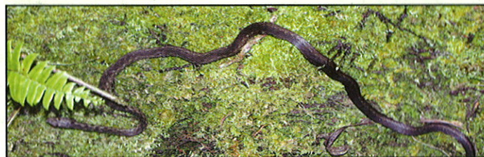
Le 'wolf snake' non venimeux ( L. seychellensis )

Longueur: entre 7 et 10 km en fonction de la route prise. Temps de parcours: 3 heures ou plus (prévoir la journée). Intérêt principal: Paysages, sites historiques. Difficulté: moyennement difficile à difficile. A Noter: voir itinéraires pour repérer les points d'information spécifique.