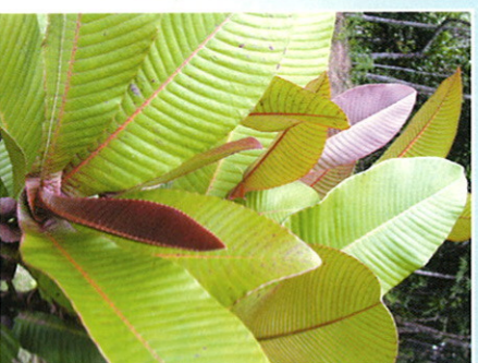
Bois rouge ( D. ferruginea )